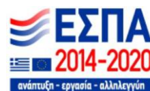
Ευρωπαϊκό Κοινωνικό Ταμείο